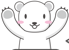
しろい べあ のすけ 白井 ペア之助